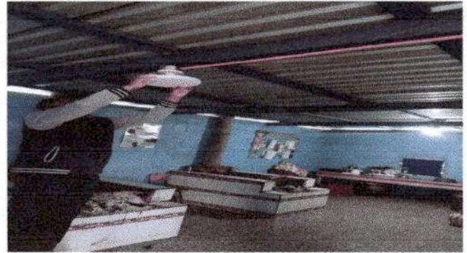
Foto 2: se hizo la sustitución de lampras o focos en cocina, aulas y dirección por falta de buena iluminación.