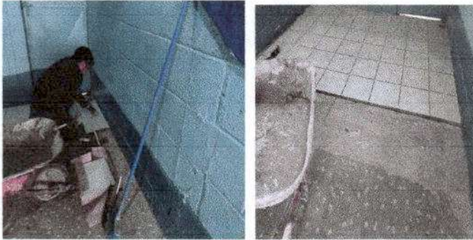
Foto 1: se realizó la sustitución de piso cerámico en la dirección del centro educativo por deterioro.